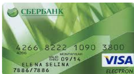
Рисунок 1 – Сбербанк-VisaElectron.